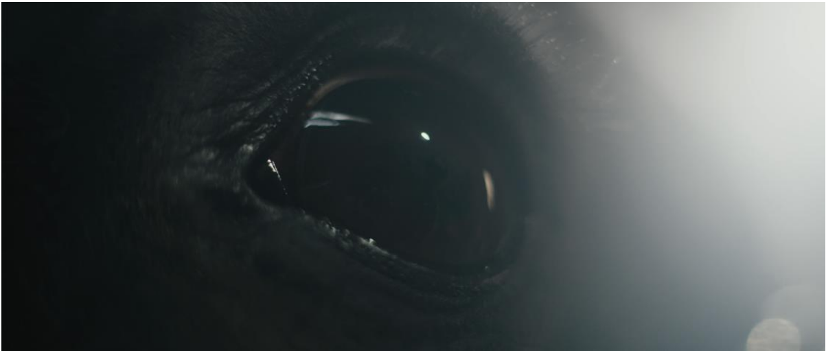
Video clip Chain Gang 2020: https://www.youtube.com/watch?v=3VSFQut39fE